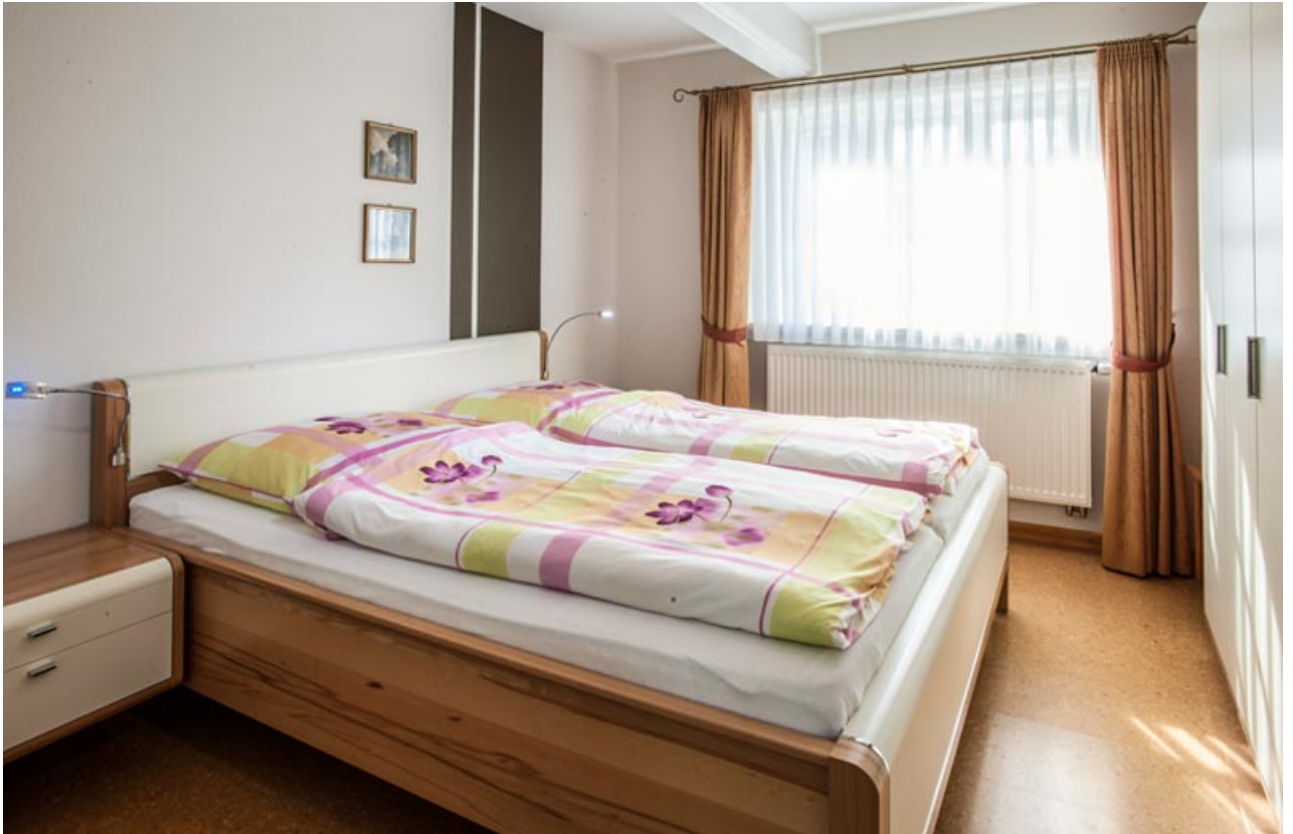
• Schlafzimmer II