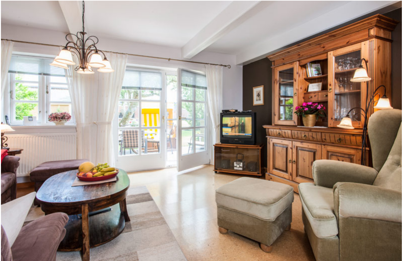
• Wohnung Maike