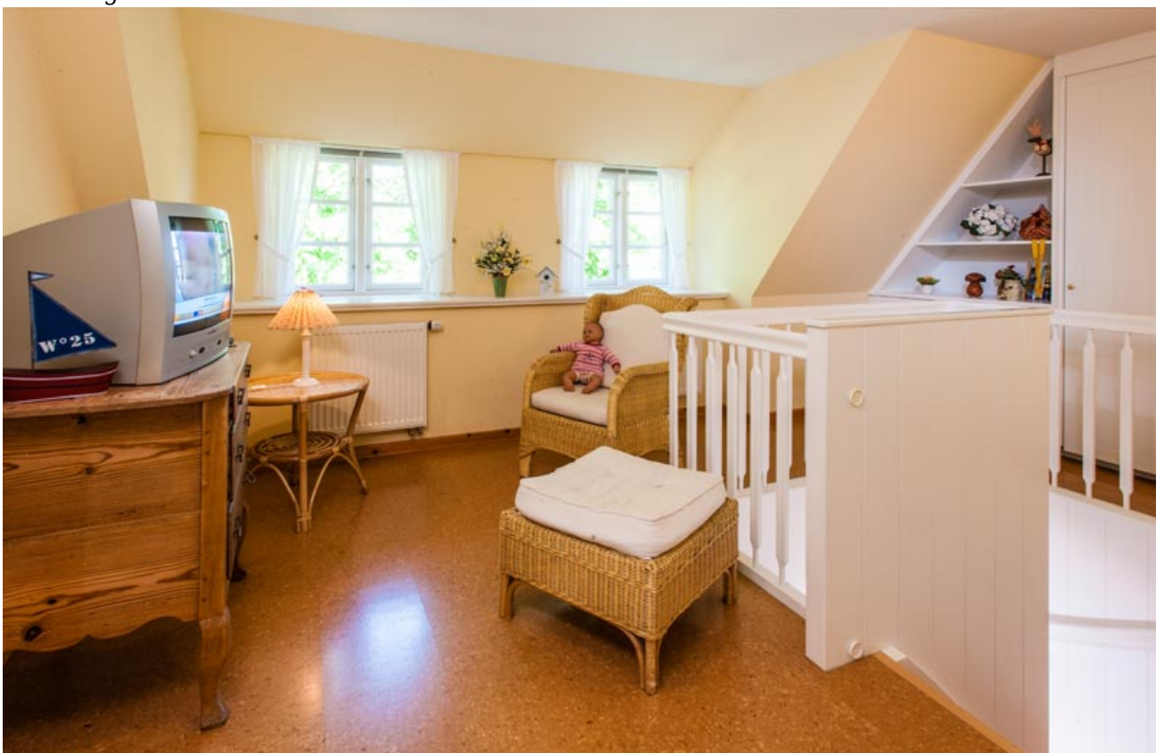
• Schlafzimmer I